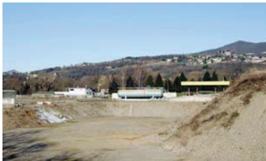
Valera, zona ex idrocarburi, in una foto d'archivio. La domanda di costruzione, trovandosi il fondo, attualmente, fuori zona edificabile, avrebbe dovuto essere pubblicata sul Foglio ufficiale. Ma il Municipio di Mendrisio non l'ha fatto; tuttavia "un'accidentale mancata pubblicazione sul FU può essere sanata mediante una pubblicazione aggiuntiva".

"Con l'inevitabile diniego della licenza edilizia da parte del Municipio di Mendrisio, e dopo la crescita in giudi-